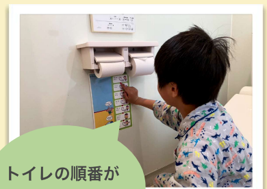
トイレの順番が書いてあるよ

例えば、小学2年生の男の子は職員と一緒に、丁寧な手洗いや歯磨き、鼻をかむ練習をしました。鼻がすっきりかめると「気持ちいいね！」と笑顔がこぼれます。また、ハンカチやティッシュを忘れずに持てるよう、イラストを貼って工夫したり、次に使う人のことを考えてトイレのスリッパを揃えたり。こうした身の回りの小さな「できた！」を積み重ねることが、自分を慈しみ、他者を思いやる心へとつながっていきます。一度で終わらせず、日々の暮らしの中で繰り返し丁寧に向き合うことで、子どもたちの行動にも少しずつ変化が見られるようになりました。これからも、子どもたちの「やる気」に寄り添いながら、家庭的な温かさの中で一緒に学んでいきたいと考えています。